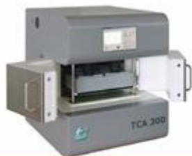
熱伝導率測定装置 TCA300