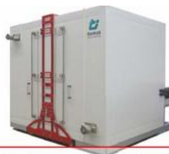
熱貫流率測定装置 TDW4040