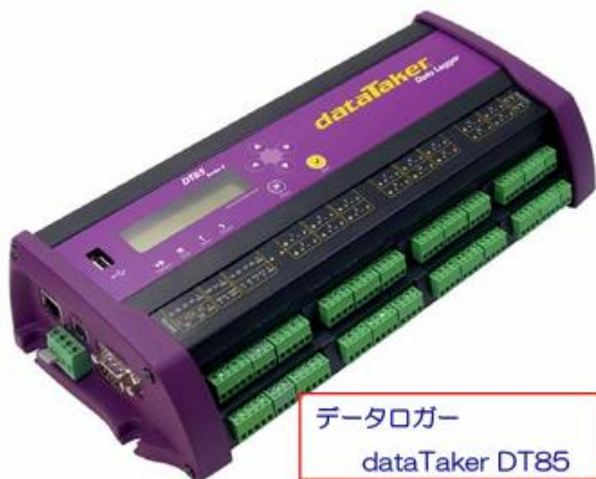
データロガー dataTaker DT85